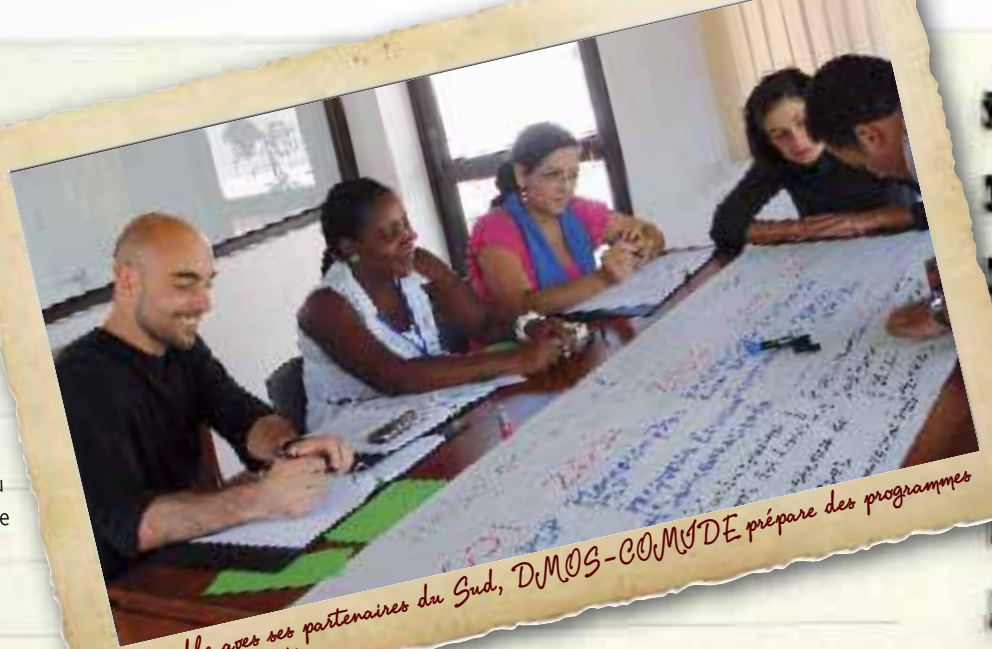
Ensemble avec ses partenaires du Sud, DMOS-COMIDE prépare des programmes de développement.