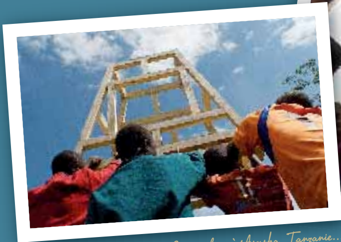
Cosmogolem à Arusha, Tanzanie...

La section menuiserie de Don Bosco Helchteren réalisera un golem en collaboration avec l'artiste. Le collège échevinal de Heusden-Zolder a décidé de placer le Golem au Bolderberg, le 21 février, jour de l'espoir. Pour l'instant, l'endroit vers lequel il partira ensuite n'est pas encore fixé, mais nous ne manquerons pas de vous tenir au courant.