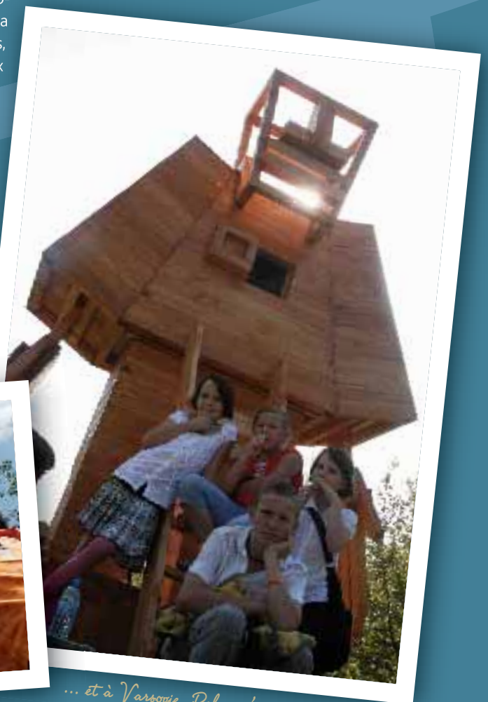
... et à Varsovie, Pologne'