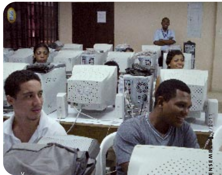
Au moins 2.000 jeunes ont trouvés un bon travail par les services de l'emploi des centres.

La communauté éducative du Centre de Formation Juan Bosco Obrero a mis en place à Ciudad Bolívar un ensemble de programmes adaptés au contexte des jeunes. Par exemple, des cours de rattrapage scolaire efficaces pour les déscolarisés, une grande garderie pour les enfants