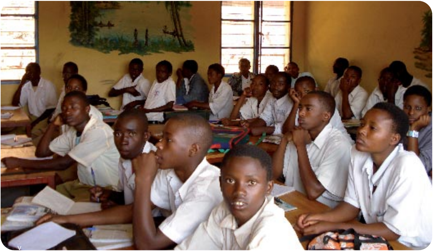
Le manque de ressources et d'enseignants qualifiés pour assurer des cours à plein.

Lorsqu'on se souvient de ses années de scolarité, on soupire souvent en pensant à tout ce temps perdu. "Enseignement obligatoire" pouvait-on lire sur l'affiche aux portes de l'école. Tant de choses semblaient tellement plus attrayantes que les bancs d'école, le tableau noir et les interminables devoirs. Pourquoi est-ce surtout les parents, les enseignants et les ministres qui insistaient pour une amélioration de l'offre et de la qualité de l'enseignement? Allons voir au Kenya.