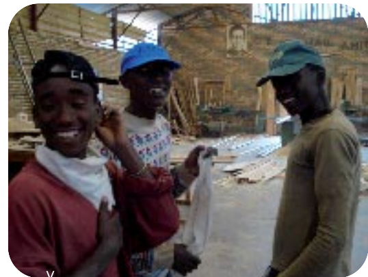
Le désavantage social des groupes faibles est directement liée à un manque de connaissances, aptitudes et compétences.

"Tu seras bientôt en vacances, tu retournes au village la semaine prochaine. Tu te réjouis?" lui dis-je.