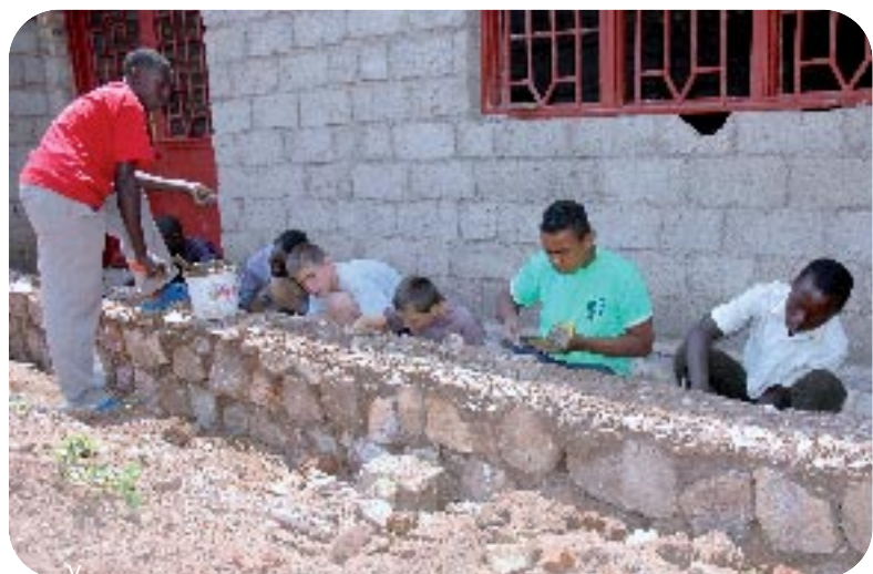
Les projets de Construction réalisés ont été diversifiés: des classe, une route, des ponts, des salles, ...

~~~~~ "Nos contacts au Rwanda sont des personnes passionnées qui assurent la durabilité des projets, mais qui surtout croient dans les jeunes." ~~~~~