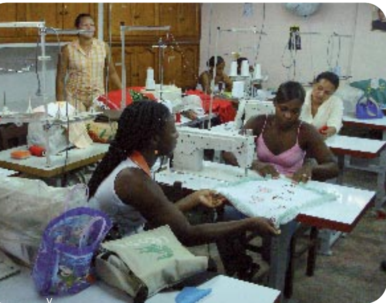
Un total de 7.500 jeunes, hommes et femmes, ont été formés dans un des multiples métiers proposés dans les centres

La Colombie, avec ses 45 millions d'habitants, est le troisième pays le plus peuplé de l'Amérique du Sud (après le Brésil et le Mexique). Ce pays est malheureusement très connu par ses problèmes concernant les actes de violence qui s'y déroulent. Très régulièrement, les nouvelles publiées nous parvenant sont dramatiques. En voici quelques unes datées du début du mois d'avril 2011: "5 personnes meurent criblées de balles à Medellin"; "Le président colombien, Juan Manuel Santos, a 11 jours pour décider l'extradition Walid Makled soupçonné de trafic de drogue"; "La garde indigène PAECES libère un jeune homme de 20 ans, séquestré depuis 8 mois par les FARC"; "L'université Javeriana de Bogotá met au point un robot capable de détecter des mines anti-personnelles" (source : www.elmundo.es ).