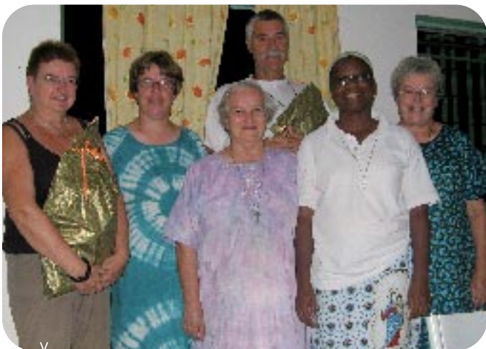
Les membres de la Cellule d'animation avec quelques sœurs à Touba.

Le samedi, ils viennent faire des petits travaux domestiques chez les Sœurs en échange des frais de scolarité.